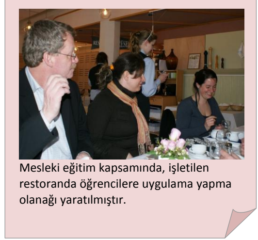
Mesleki eğitim kapsamında, işletilen restoranda öğrencilere uygulama yapma olanağı yaratılmıştır.

Belediye meclisi 51 kişiden oluşmaktadır. Meclis, yönetim kurulu ve komite üyelerini seçmektedir. Yönetim Kurulu 15 kişiden oluşmakta olup, belediye bütçesini hazırlama görevi vardır. Katrineholm Belediyesi'nde çeşitli görevleri üstlenen komiteler: Eğitim Komitesi, İnşaat ve Planlama Komitesi, Kültür ve Turizm Komitesi, Çevre Sağlığı Komitesi, Hizmetler ve Teknoloji Komitesi, Sosyal Komite, Seçim Komitesi, Sağlık Komitesi ve icra komitesidir.