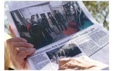
Katrineholm Belediyesi'ne yapılan gezi yerel gazetede haber olarak verilmiştir.

Program devam ederken, aynı zamanda bu programın bir diğer amacı olan İsveç'in geleneksel ve kültürel yapısını tanıma fırsatı tanıyan birçok aktivite düzenlenmiştir. Misafir olarak kalınan ailelerin günlük yaşantıları, arkadaşları ve yakın akrabaları ile tanışılmış, geleneksel ve kültürel değerler,